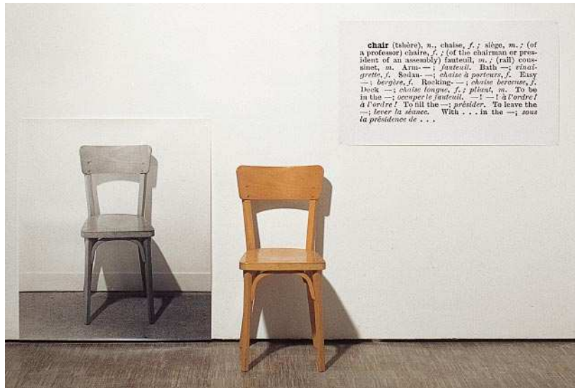
Joseph Kosuth, One and Three Chairs, 1965

Les trois volets que constituent cette pièce doivent être considérés comme un triptyque, avec une progression dramatique et donc visuel : la première histoire est concrète, la deuxième est plus surréaliste quand à la troisième partie, elle nous plonge dans un univers où la fiction prend le pas sur la réalité.